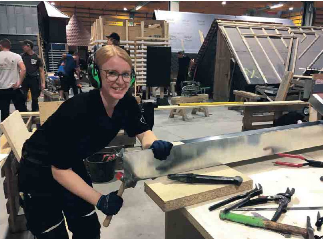
Im Dachdeckerhandwerk ist nicht mehr nur reine Muskelkraft gefragt. Dafür aber vielseitige Fähigkeiten, die den Beruf zunehmend für Frauen interessant machen.

Traditionelle Männerberufe werden zunehmend auch für Frauen interessant. Denn mittlerweile ist nicht mehr reine Muskelkraft gefragt. Zum Beispiel im Dachdeckerhandwerk: Dachziegel werden nicht mehr nach oben geschleppt, dafür gib es Lastenaufzüge, mittlerweile auch für sperrige Photovoltaik-Anlagen. Für erste Dach-Begutachtungen werden Drohnen losgeschickt, Materialien werden in kleinere Pakete gepackt, damit sie weniger wiegen. Dafür ist es ein unglaublich vielseitiger Beruf: Fassaden und Dächer werden gedämmt, mit ganz unterschiedlichen Materialien und Verfahren. Bei Sanierungen wird auch mal ein Dach komplett neu eingedeckt, zum Beispiel mit Schiefer, Dachziegeln, Holzschindeln oder auch Metall. Im Norden Deutschlands gibt es wunderschöne Reetdächer. Für mehr Licht sorgen neue Dachfenster und wenn Bauherren selbsterzeugten Strom nutzen wollen, dann installieren Dachdeckerinnen und Dachdecker Photovoltaik-Anlagen oder planen auch mal ein Gründach. Damit ist