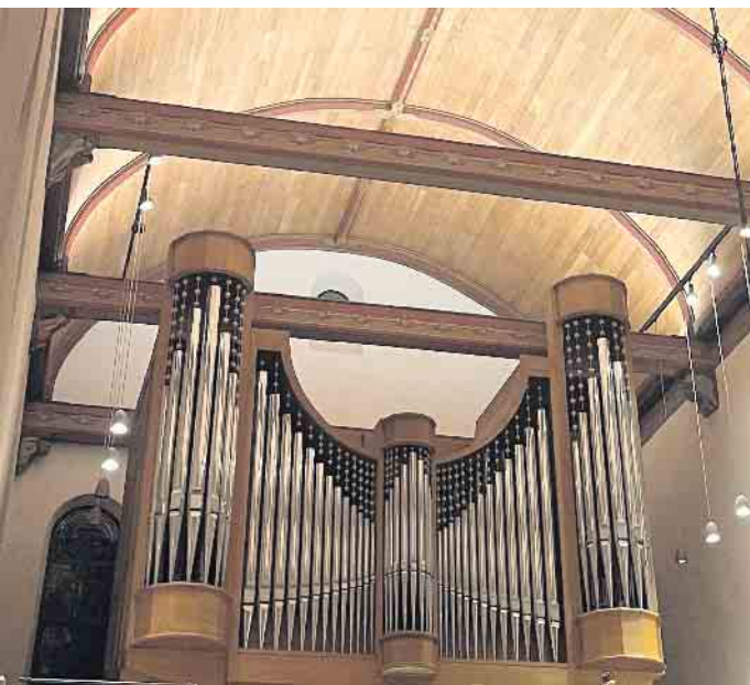
Die Weyland-Orgel in St. Walburga, Walberberg.