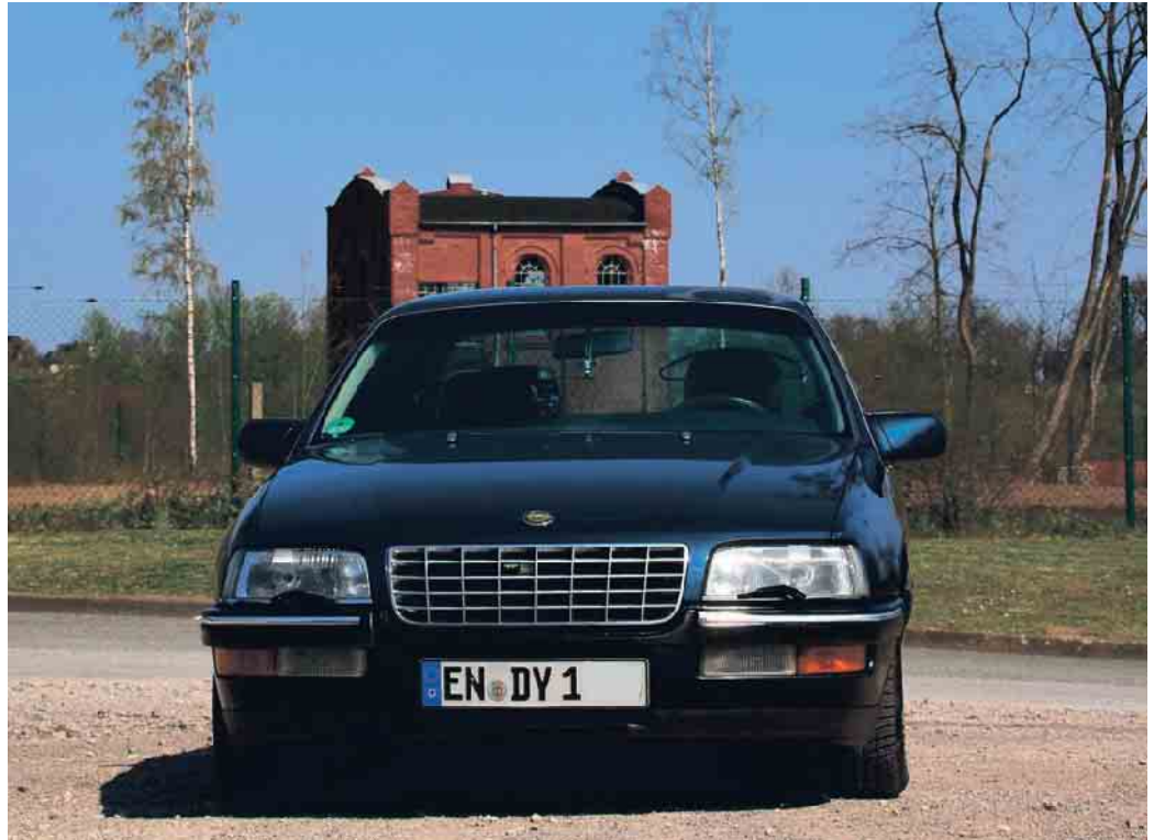
Autokennzeichen müssen von Gesetzes wegen gut lesbar sein.