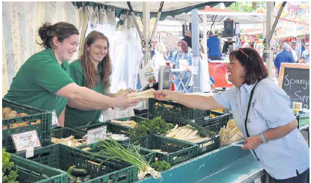
Wie könnte es anders sein: Das Königsgemüse Spargel ist natürlich ein Star bei den „Bornheimer Frühlings- und Spargelwochen“.

Musikschule + 50 Jahre Musikschule in Bornheim“ im Rathaus (Rathausstraße 2, Roisdorf)