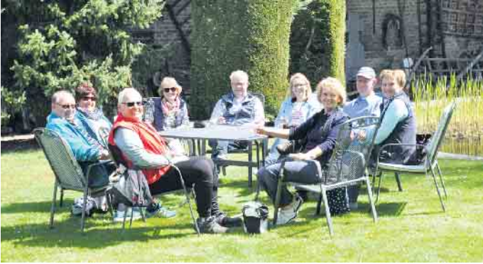
Eine gemütliche Pause, beispielsweise im Marienhof der Weinkellerei Antwerpen, gehört unbedingt zu einer gelungenen Fahrradtour.