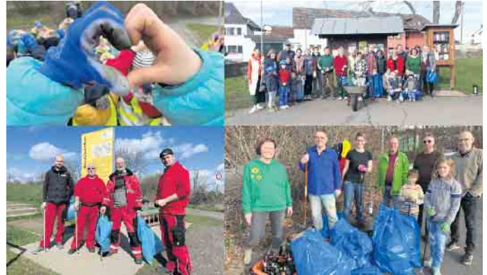
Frühjahrsputz in Alfter mit vielen fleißigen Teilnehmenden

vorhandene Mülleimer zu benutzen. Die Teilnahme an der Aktion führte zu einem größeren KITA-Projekt zum Thema Müllentsorgung und Nachhaltigkeit. Die OGS Witterschlick beteiligte sich mit 40 Kindern und Begleitung und weiteren Einzelpersonen bzw. Kleingruppen im gesamten Alfterer Gemeindegebiet. Die Firma WRS Service GmbH sammelte mit 5 Mitarbeitenden den Müll auf einer großen Streuobstwiese im Bereich des Landschaftstors im „Grünen C“ ein. Die Fraktion Bündnis 90/Die Grünen säuberte die Ufer des Hardtbachs in Oedekoven. Aktionen, wie diese, bleiben leider immer noch notwen-