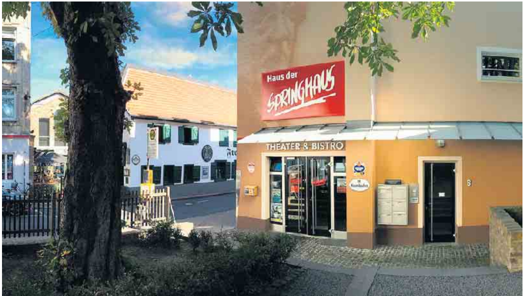
Außenansicht des Theaters Haus der Springmaus

Prädikat: Bedingungslos sehenswert. Aber auch sonst lohnt sich ein Blick in das Programm unseres Theaters. Wir freuen uns auf Sie.