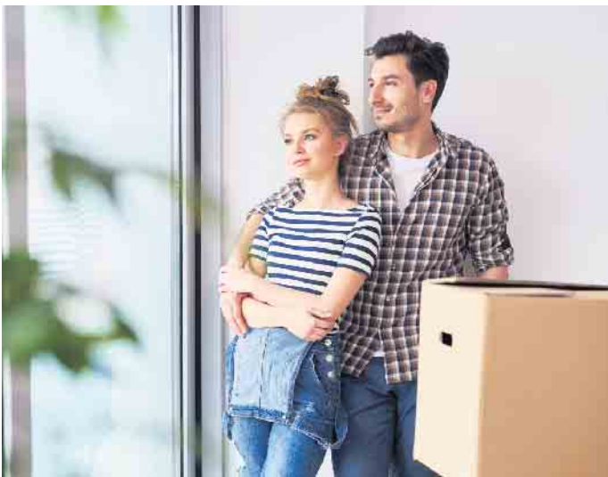
Eine Immobilienfinanzierung ist für die meisten Menschen ein Kraftakt. Gegen den Worst Case, dass das Arbeitseinkommen wegfällt, kann und sollte man sich absichern.