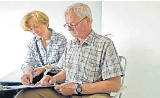
Angebote von Bauunternehmen für den Bau der eigenen vier Wände sollte man genau unter die Lupe nehmen, gegebenenfalls mit sachverständiger Unterstützung.