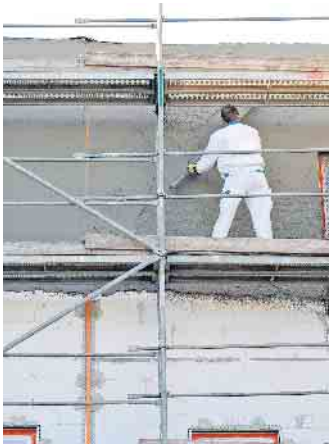
Wenn das „richtige“ Unternehmen als Vertragspartner gefunden wurde, kann es mit dem Bau endlich losgehen.

darf nicht fehlen. Gegebenenfalls muss er zudem gewünschte Sonderleistungen oder Gutschriften für Eigenleistungen enthalten, die nach Lohn- und Materialanteil aufgeschlüsselt sind. (djd)