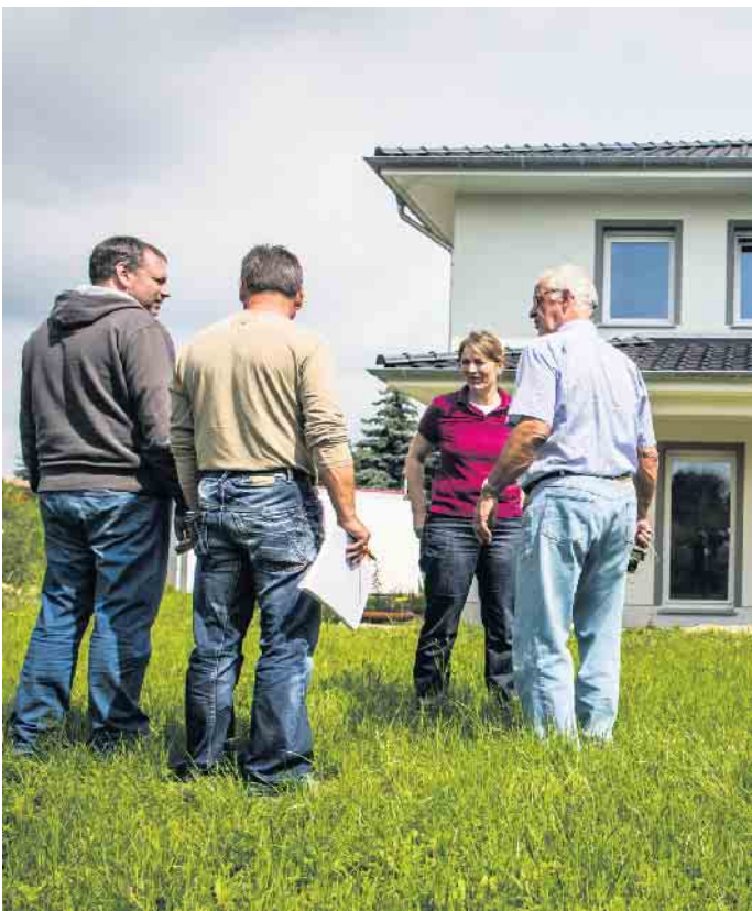
Bei der Suche nach einem geeigneten Baupartner kann auch die Besichtigung bereits errichteter Referenzobjekte dieses Anbieters helfen.