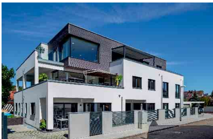
Mehrgenerationenhäuser in Holz-Fertigbauweise sind im Kommen.

Früher war es normal, dass mehrere Generationen in einem Haus lebten, um sich dort gegenseitig zu unterstützen, um aufeinander Acht zu geben und