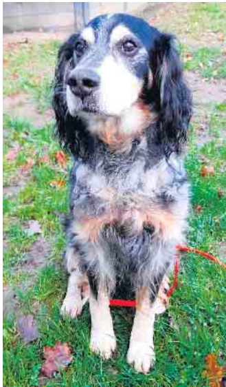
Pinky DE14 5775 1310 0000 4107 87 + VoBa IBAN DE74 5776 1591 0201 8159 0

Mehr Infos über sie gibt es hier: www.tierheim-remagen.de . Blankertshohl 25, 53424 Remagen. 02642/21600. Spendenkonto: Tierheim u. Tierschutzverein Kreis Ahrweiler e.V., KSK Ahrweiler IBAN