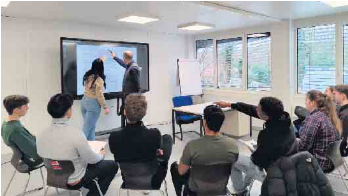
Im Leistungskurs Deutsch werden Themen angeregt diskutiert.

An der Gesamtschule im Klostergarten wird 2024 der erste Abiturjahrgang verabschiedet