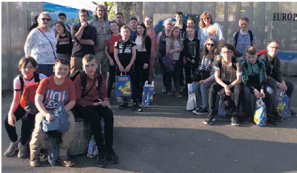
Gastschüler und ihre begleitenden Lehrer freuen sich mit ihren Gasteltern über eine erlebnisreiche gemeinsame Zeit.