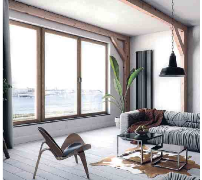
Eine energetisch optimierte Gebäudehülle mit Wärmedämmglas reduziert den Heizbedarf und auch die sommerliche Kühllast jedes Gebäudes.

pumpe gewählt werden, die exakt auf den winterlichen Wärme- und sommerlichen Kühlbedarf des Gebäudes abgestimmt ist“, erläutert Jochen Grönegras, Hauptgeschäftsführer des Bundesverbandes Flachglas e.V. (BF). Erst dämmen, dann die richtige Wärmepumpe wählen - diesen Ratschlag gibt der Bundesverband Flachglas Sanierern für mehr Nachhaltigkeit und Effizienz. Denn eine energetisch optimierte Gebäudehülle reduziert den Heizbedarf und auch die sommerliche Kühllast jedes Gebäudes. Der Energiebedarf wird insgesamt verringert und die Wärmepumpe kann anschließend kleiner und kostengünstiger