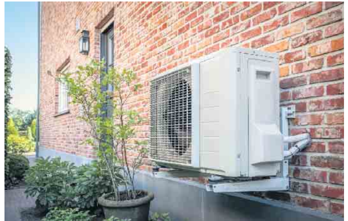
Moderne Wärmepumpen eignen sich auch für die Modernisierung und energieeffiziente Beheizung älterer Wohnhäuser.

ob ihre ältere Immobilie mit dieser Technologie zu vernünftigen Kosten beheizt werden kann. Die Technik sei ausgereift, meint Erik Stange vom Verbraucherschutz-