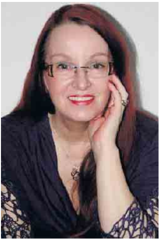
Petra Hammesfahr

1991 veröffentlichte sie ihren ersten Roman. Ab Mitte der 1990er war sie eine der erfolgreichsten deutschen Krimiautoren. Sie ist verheiratet, hat drei Kinder und lebt in Kerpen im Rhein-Erft-Kreis. Petra Hammesfahr stellt ihre neuesten Krimis vor, am Freitag, 17. März, im Pfarsaal St. Matthäus. Beginn 19.30 Uhr, Einlass 19 Uhr. Eintritt 9 Euro (für Mitglieder des Fördervereins 7 Euro). Nur Abendkasse - Anmeldung er-