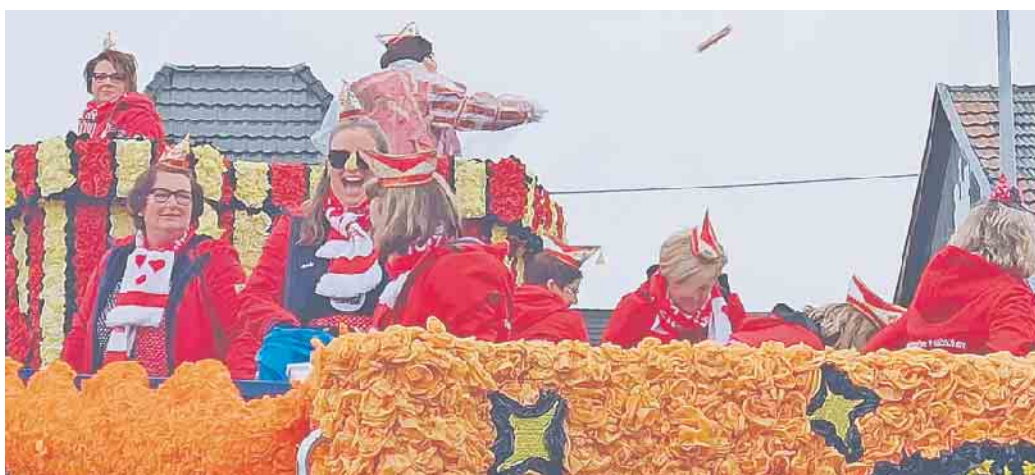
Das Damenkomitee „Herzblättchen“ war wie immer jot drop.