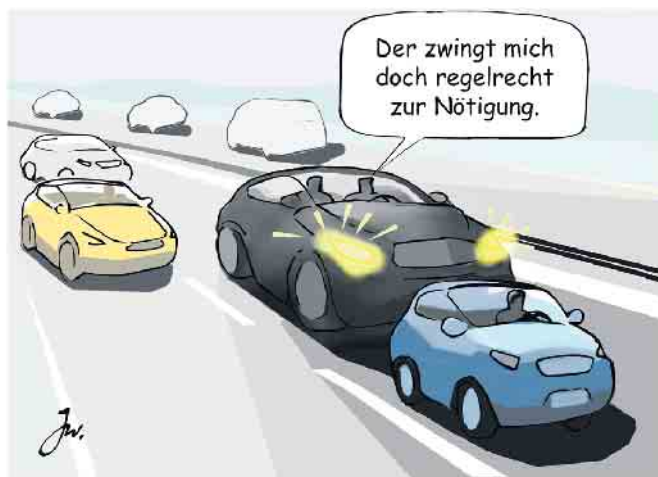
Falsche Reaktion auf Drängler: Demonstratives Langsamfahren auf dem linken Fahrstreifen trägt zur Eskalation bei.

ler unter Druck gesetzt fühlt, sollte man nicht hartnäckig auf seinem Recht bestehen, sondern dem nervenden Zeitgenossen möglichst schnell das Überholen ermöglichen - ohne Hektik und ohne andere Autofahrer in Bedrängnis zu bringen. Ebenso gilt es zu vermeiden, die Bedrängnis, in die man durch den aufdringlichen Hintermann gebracht wird, an das vorausfahrende Fahrzeug weiterzugeben, indem man sich diesem zu sehr nähert. Denn daraus können unliebsame Kettenreaktionen resultieren. Zur Vermeidung solcher Situationen ist es ebenfalls ratsam, bei einem eigenen Überholvorgang immer wieder - alle fünf bis zehn Sekunden raten die Fachleute - zu kontrollieren, dass man nicht ein schnelleres Fahrzeug hinter sich behindert. Manche Autofahrer begehen den Fehler, wenn ein Fahrzeug mit höherer Geschwindigkeit hinter ihnen auftaucht,