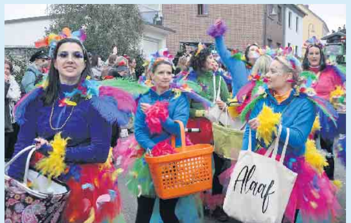
Alaaf. Lecker Mädche in kreativen Kostümen verzauberten die Jecken am Wegesrand.