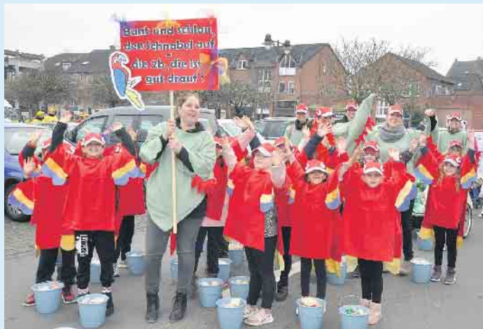
Dass die 2b der Anna Schule jot drop war, war nicht zu übersehen.

Alfterer Nachwuchsjecken haben nichts verlernt - Schulen und Kitas stellten fast 30 Gruppen