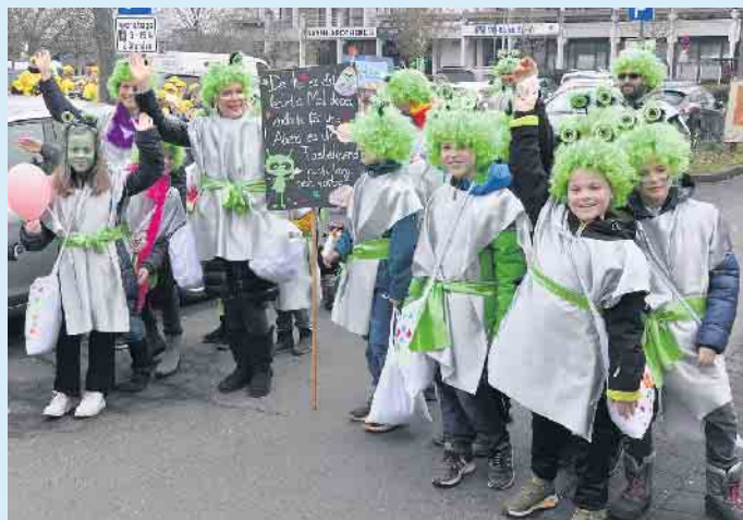
Auch wenn die Pänz der 4a im Sommer die Schule wechseln, versprechen sie dem Fastelovend treu zu bleiben.

Alfter-Ort. Es war eine Lust zu sehen und zu erleben, mit welcher Begeisterung undwelchem Einfallsreichtum die jungen Jecken ihren Zug gestalteten. Und das, obwohl sie seit 2020 wegen der Corona-Bestimmungen bis jetzt warten mussten. Drei Jahrgänge waren so zum ersten Mal dabei. Aber das tat der Freude und Ausgelassenheit keinen Abbruch. Über 500 Nachwuchskarnevalisten zeigten, dass sie von diesem Brauchtum begeistert sind. Das gibt Mut und Hoffnung, dass auch künftige Generationen diesen unverzichtbaren Baustein gemeinschaftlichen Lebens im Rheinland auf ihre Art interpretieren und fortführen werden. Nach dem Zug ging es dann noch zur „Jecke Pänz Party“ in die Turnhalle. „Mir Pänz wolle net noch mieh Zick verliere, un donn de Fastelovend zesame me öch fiere“. Dieses