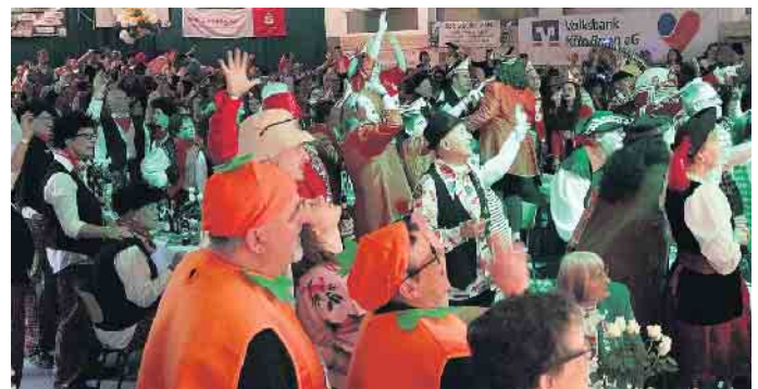
Die Stimmung beim Jubiläums-Kostümfest war wieder einmal überwältigend.

Als nächstes steht nun die Teilnahme am Witterschlicker Karnevalszug am Sonntag, 11. Februar, auf dem närrischen Tableau. Die grün-weißen Festwagen und die große Fußtruppe werden sicherlich dem Zug einen besonderen Stempel aufdrücken und nicht zu übersehen sein. Wer meint, damit seien die Alpenrose-Festivitäten abgeschlossen, muss sich eines Besseren belehren lassen. Eine große Jubiläums-Feier startet noch am 25. Mai und am folgenden Tag gibt es den großen Jubiläums-Festumzug durch Witterschlick mit anschließendem Familienfest. Weitere Informationen: kg-alpenrose.de (WDK)