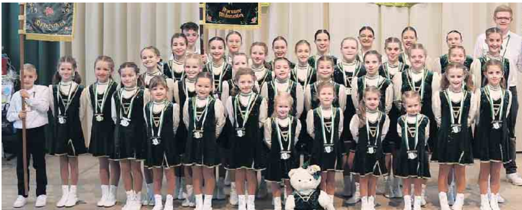
Die Garden der KG begeisterten mit ihren Tänzen an jedem der Festtage die Gäste.