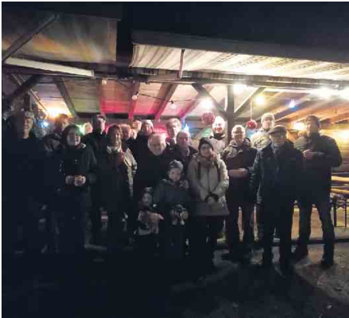
Das 9. Fenster