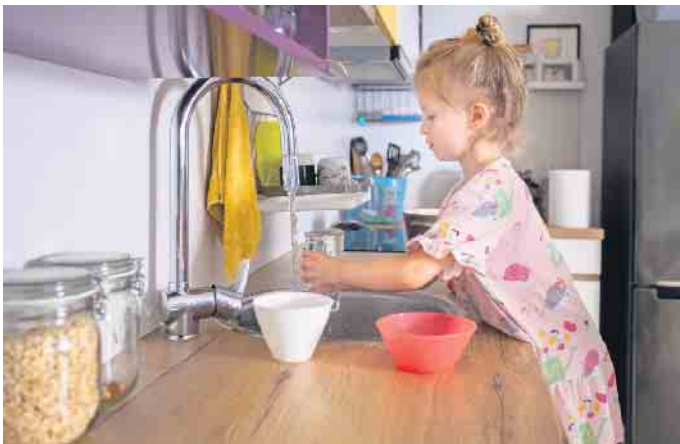
Wasser aus dem Hahn zu trinken, ist auch eine Frage der Gewohnheit.

Umfrage: Regelmäßiger Konsum von Wasser aus dem Hahn ist deutlich gestiegen