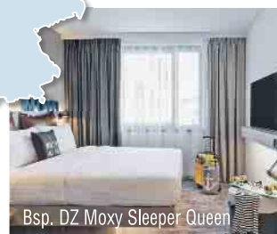
Bsp. DZ Moxy Sleeper Queen