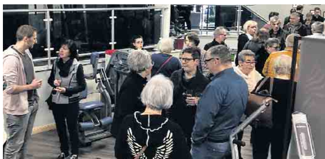
Der Neujahrsempfang im Oedekovener Aktivo-Studio war mit über 100 Gästen ein voller Erfolg.