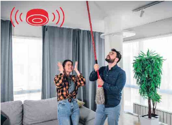
Sollten Rauchmelder einmal unerwünscht piepen, ist es hilfreich, wenn die Geräte mit einem Stummschaltknopf ausgestattet sind. Im Optimalfall ist der so groß, dass er sich bequem vom Boden aus erreichen lässt.

mer, die durch ein engmaschiges, verklebtes Fliegengitter gesichert ist, schützt vor Fehlalarmen durch Insekten. Zudem lohnt es sich, Rauchmelder mit dem Qualitätssiegel „Q“ zu erwerben. Die spezielle Verschmutzungskompensation und zuverlässige Sensorik sorgen dafür, dass die Melder nur Alarm geben, wenn sie sollen. Die Wahrscheinlichkeit für Fehlalarme steigt zudem mit dem Alter der Rauchmelder. Wer ihn nach zehn Jahren austauscht, senkt das Risiko deutlich. Wichtig zum Vermeiden von Fehlalarmen ist, dass die Installation