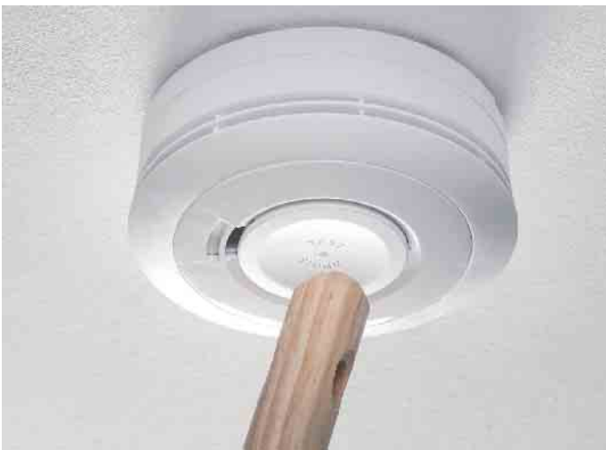
Ein großer Stummschaltknopf bei Rauchmeldern erleichtert das temporäre Deaktivieren des Signaltons ohne Leiter.