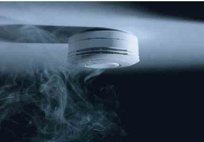
Rauchmelder erkennen Brände bereits in der Entstehungsphase und warnen frühzeitig durch ein lautstarkes, akustisches Signal. Die Installation ist bundesweit gesetzlich vorgeschrieben.

10-Jahres-Batterie setzt, stellt die Stromversorgung des Rauchmelders über die gesamte Lebensdauer sicher. Nach zehn Jahren sollten die Geräte ohnehin ausgetauscht werden. Doch auch bei voll funktionsfähigen Batterien kommt es vereinzelt zu Fehlalarmen. Die Gründe dafür liegen in der Funktionsweise von Rauchmeldern. Sie arbeiten nach dem fotooptischen Streulichtprinzip: Sobald Partikel in die Kammer eindringen, wird das Licht gestreut und der Alarm ausgelöst. Das kann auch durch in die Kammer gelangte Insekten oder Schmutz geschehen. Um Fehlalarme zu vermeiden, sollte man schon beim Kauf der Rauchmelder einige Aspekte berücksichtigen. Die Entscheidung für Geräte mit einer Rauchkam-