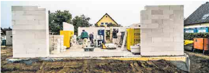
Auf dem Weg ins Wohneigentum stoßen immobilieninteressierte Verbraucher auf hohe Hürden, wie ein aktuelles „Bauherren-Barometer“ zeigt.

für Familien mit durchschnittlichem Einkommen erreichbar bleibt. Bauherren, die auf der Suche nach einem gangbaren Weg ins Wohneigentum sind, finden auf der Website des Vereins unter www.bsb-ev.de eine Vielzahl von Hintergrundinfos zum Bauen und Kaufen. Sie können sich zudem unabhängig bei der Planung und Umsetzung ihrer Immobilienpläne beraten lassen. (djd)