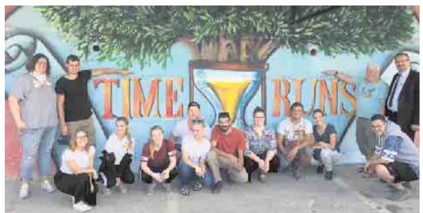
Kunstprojekt in Bethlehem

JugendInterKult e.V. bietet von Erasmus + besonders geförderten zweiseitigen Jugendaustausch (ca. 18-26 Jahre) in Israel-Palästina-Jordanien (30.9.–15.10., NRW-Oktoberferien) an mit tollem Programm und unschlagbarem Preis-Leistungs-Verhältnis. Bei Anmeldung bis 15.02. gibt es 160 € Frühbucherrabatt .