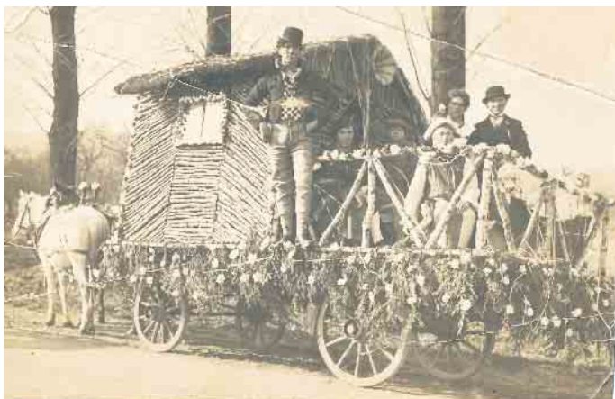
Holzwagen aus dem Jahr 2026. Das Foto ist von der Prinzengarde zur Verfügung gestellt.