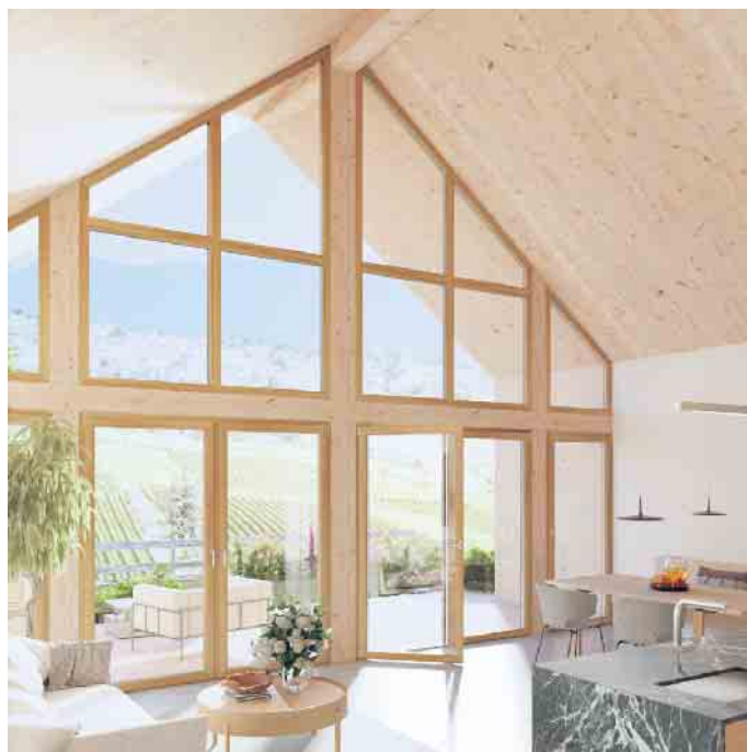
Bei großen Fensterfronten ist der Energiespar-Effekt von gut gedämmten Fenstern besonders groß.

der Preisspirale ist nicht in Sicht. Wegen der schrittweisen Anhebung des CO 2 -Preises werden die Energiepreise in den nächsten Jahren absehbar weiter steigen. Wer langfristig sparen möchte, sollte jetzt seinen Energieverbrauch reduzieren - auch als Beitrag zum Klimaschutz. Hier steckt großes Potenzial in den eigenen vier Wänden: Eine energetische Sanierung reduziert den Heizenergiebedarf deutlich und senkt