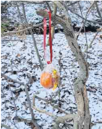
Liebevoll gepackte Tütchen für die Kinder

hatten die Aktion damals ins Leben gerufen. Über 100 Erwachsene und Kinder sowie zehn Hunde hatten sich vor dem Dorfhaus in Gielsdorf am 3. Januar eingefunden und freuten sich auf eine Wanderung diesmal durch den weiß „gezuckerten“ Wald. Und es gab gleich mehrere Überraschungen. Für die Kinder hatten fleißige Helfer den Wegesrand mit liebevoll gepackten Tütchen versehen. Auf der Hälfte der Strecke wurde eine kleine Pause eingelegt. An der Hütte auf der Breiten Allee hatte man eine Feuer-schale aufgestellt und es wartete Glühwein und Kinderpunsch auf die Teilnehmenden. Die Teilnehmenden nutzten die Pause und tauschten sich über die Ereignisse des Jahreswechsels und die Vorsätze für das Neue Jahr aus. Dann ging es zurück zum Dorfgemeinschaftshaus. Dieses war ab 15:30 Uhr für ältere Menschen, die nicht an der Wanderung teil-