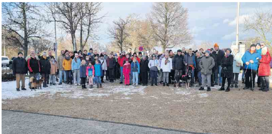
Die Teilnehmenden vor der Wanderung.