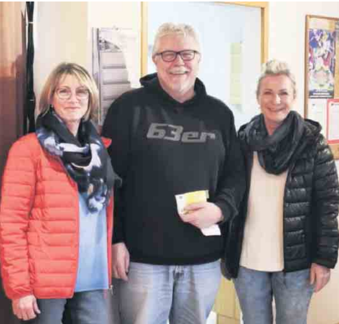
Fröhliche Gesichter bei der Spendenübergabe

Glühwein-Event im Herbstbenden für die gute Sache