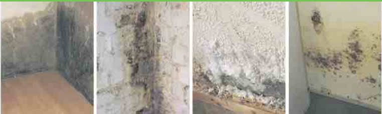
Defekte Horizontalsperre Querdurchfeuchtung Ausblühungen Schimmelbefall