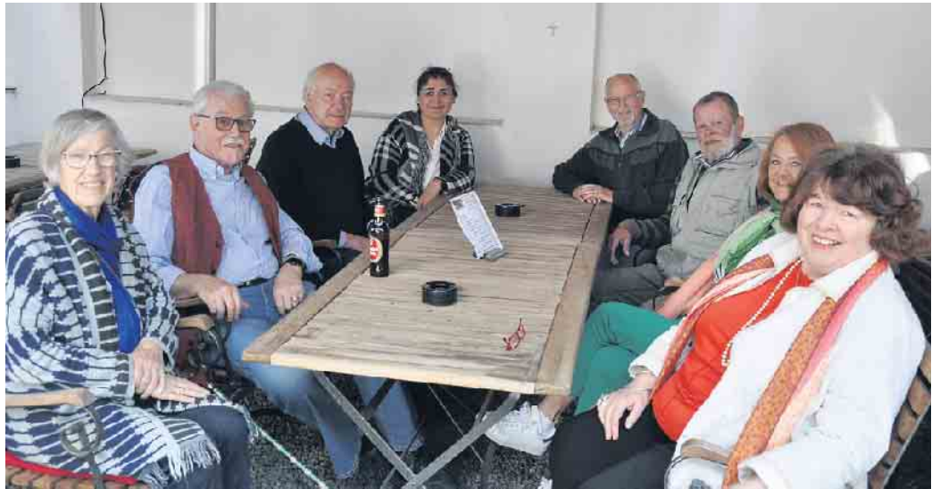
Glückliche Gesichter bei allen Beteiligten, als am 22. April die Hofcafésaison startete.

Fast 100 Besucher kamen zur diesjährigen Ausstellung „Witterschlicker Künstlerinnen und Künstler“