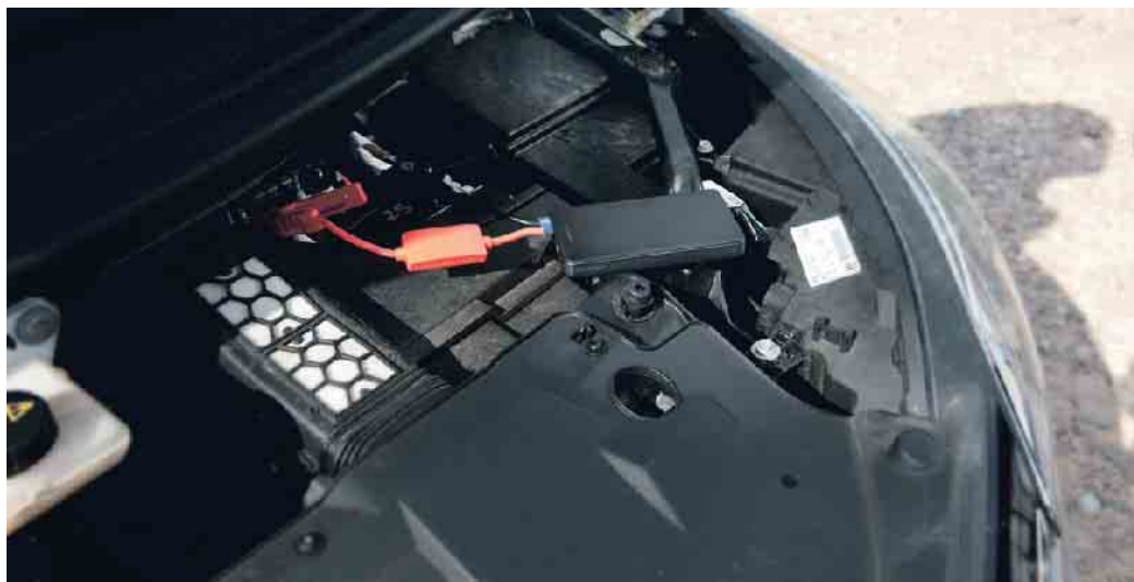
Akku-Booster in Aktion: Rote Polklemme an Plus, schwarze Polklemme an Minus, dann fließt der Strom.

Der Booster läuft mit zwölf Volt und kann mit Polklemmen an die schlappe Batterie des Autos angeschlossen werden, heißt es beim Automobilclub ACE. Dazu die rote Polklemme an Plus anklammern, die schwarze Polklemme an Minus und prüfen, ob die Klemmen richtig sitzen. Fünf Minuten warten und den Motor starten. Sobald der Motor läuft, den Booster so schnell wie möglich abklemmen. Das Starthilfegerät sollte unbedingt über einen Schutz vor Kurzschlüssen verfügen. Damit wird Schlimmeres verhindert, wenn sich beide Polzangen bei eingeschaltetem Booster berühren. Auch ein Verpolungsschutz kann im Zweifelsfall sehr hilfreich sein. Dadurch schaltet sich der Booster erst gar nicht ein, wenn die Polzangen des Starthilfegeräts versehentlich falsch angeklammert werden. Außerdem sollte beim Kauf dar-